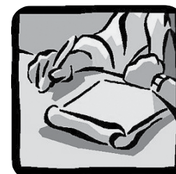
Recuadro N°2: Ficha de caracterización de ASSET.

ASSET es una herramienta que provee de una estructura para ordenar y analizar la información recopilada, pero no se utiliza como una pauta de encuesta. Para obtener la información, el operador debe realizar entrevistas al joven y a su familia y recopilar antecedentes de diferentes fuentes.